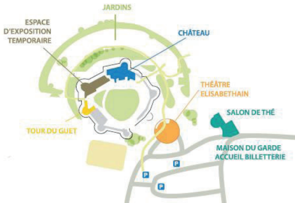
Plan du Château d'Hardelot - La Chapelle est accolée à la Tour de guet