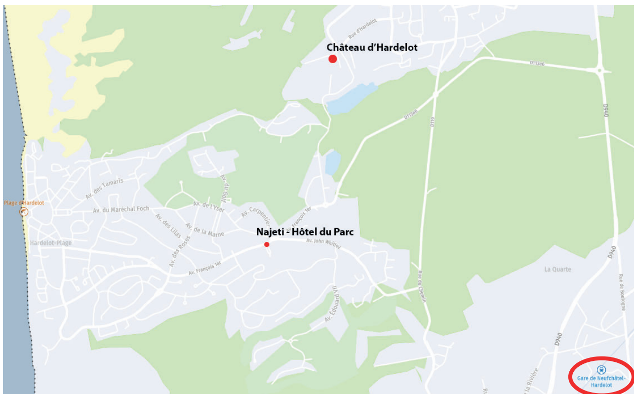
Plan de Neufchâtel - Hardelot et de Condette

Les points rouges sur la carte repèrent le Château d'Hardelot, lieu du colloque, et le Najeti-Hôtel du Parc, hébergement prévu pour les participants.